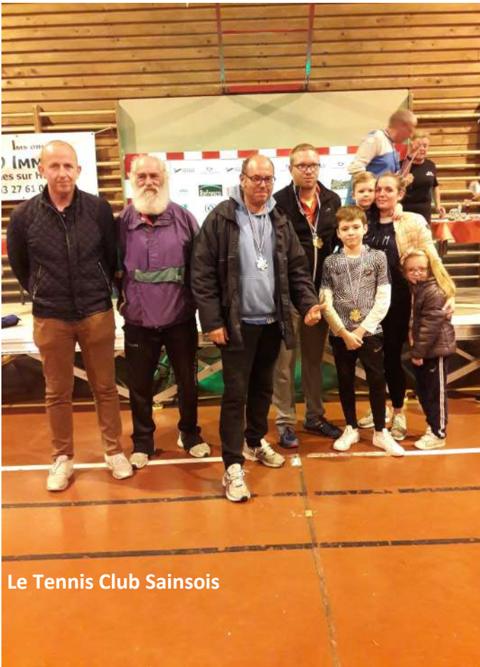
Le Tennis Club Sainsois