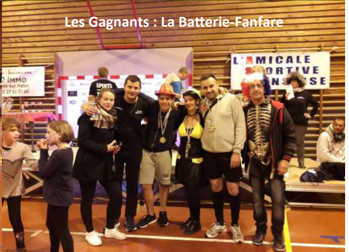
Les Gagnants : La Batterie-Fanfare