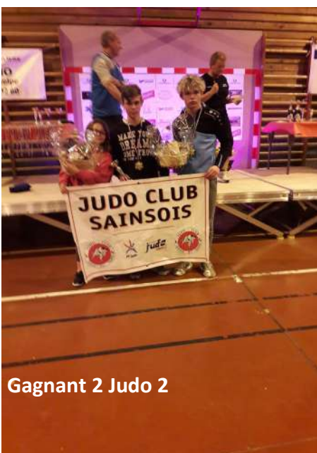
Gagnant 2 Judo 2