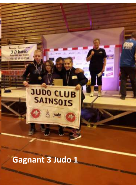
Gagnant 3 Judo 1