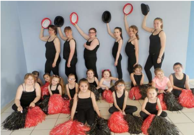
Club de danse Strass'dancers Sains du Nord